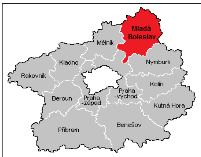
Obrázek č. 1: Poloha okresu Mladá Boleslav v rámci Středočeského kraje